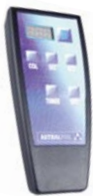
Mando a distancia Remote control