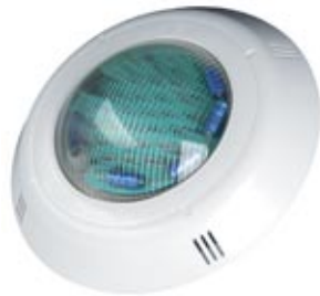
Proyector por LEDs LED Pool Lights