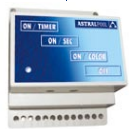
Receptor - modulador Receiver - modulator